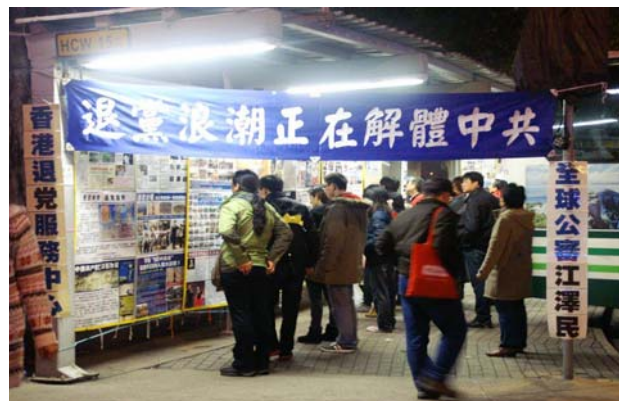
大陆中国游客在香港金紫荆观看法轮功真相看板

他说，来香港购物，其实最吸引人的是那些大陆禁书，这对国内人太具有吸引力了。大街小巷的书摊上，可淘的宝不少，这些反共杂志就在马路边的书摊上摆着，忍不住买了一摞。里面的话题都不错，特让人感兴趣。问他带回来了？他有点得意，说那当然了。提到当时买书的时候，团友拦他怕惹麻烦。导游带着购物，也在旁边看着呢。他冲导游说：“没人举报就没事，导游，是吧？”