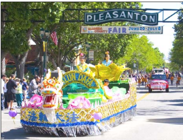
法轮功学员精心制作的花车

【明慧网二零一二年六月二十五日】（明慧记者王英加州普莱森顿市报导）六月二十三日，美国旧金山湾区部份法轮功学员参加了在普莱森顿市举行的“阿拉米达县园游会游行”，其中，由法轮功学员组成的天国乐团和花车队备受瞩目。