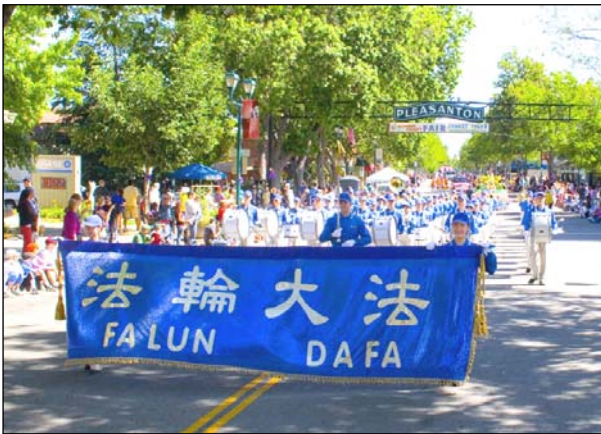
旧金山天国乐团应邀参加阿拉米达县园游会游行