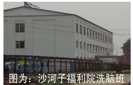
图为：沙河子福利院洗脑班