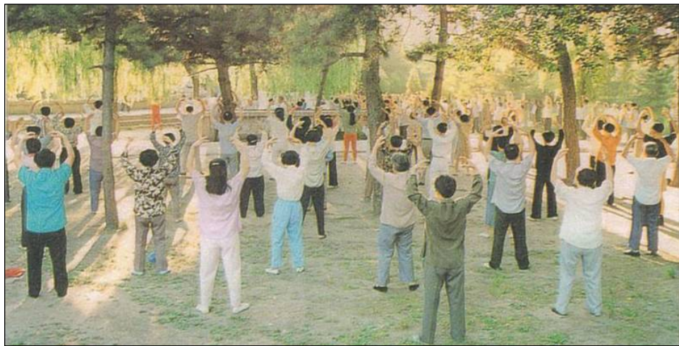
历史图片：1996 年长春法轮功学员集体晨炼法轮功