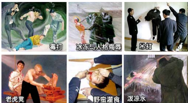
法轮功学员遭受的部分酷刑

名义上“610”是政府下属的一个办公室，可它并不是隶行政政府职能的机构，干的是非法限定人身自由、劫持关押公民、指挥公安、安全局监听、监控、秘密绑架法轮功学员，干涉法律公正、强制洗脑、实施暴力、非法入侵民宅、策划恐怖行为、制造谎言、任意胡作非为、自立土政策，执有生杀大权。它既不隶政，建树政绩，它又超越宪法，取代法律，害民害国，是地地道道的非法组织。