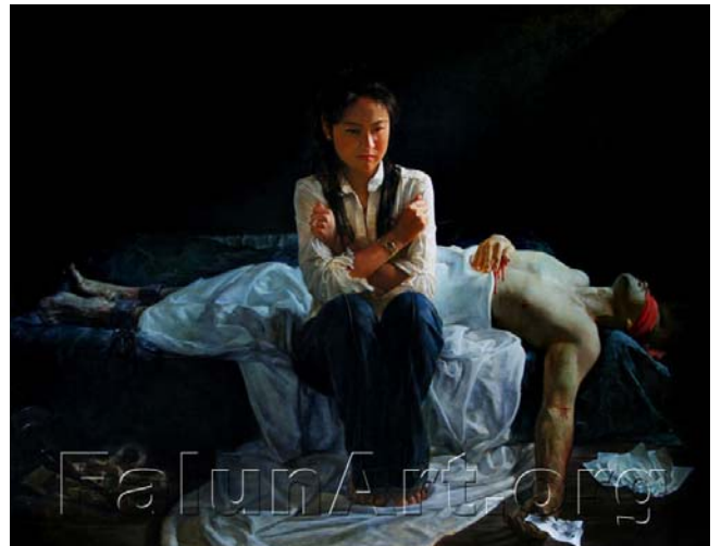
真善忍国际美展作品《蒙难在中原》