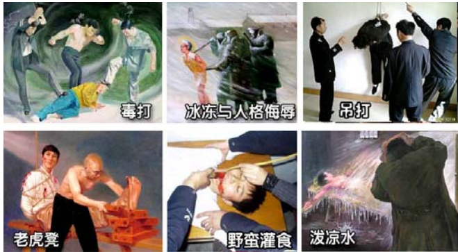
法轮功学员遭受的部分酷刑

名义上“610”是政府下属的一个办公室，可它并不是隶行政政府职能的机构，干的是非法限定人身自由、劫持关押公民、指挥公安、安全局监听、监控、秘密绑架法轮功学员，干涉法律公正、强制洗脑、实施暴力、非法入侵民宅、策划恐怖行为、制造谎言、任意胡作非为、自立土政策，执有生杀大权。它既不隶政，建树政绩，它又超越宪法，取代法律，害民害国，是地地道道的非法组织。