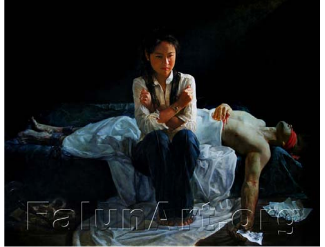
真善忍国际美展作品《蒙难在中原》