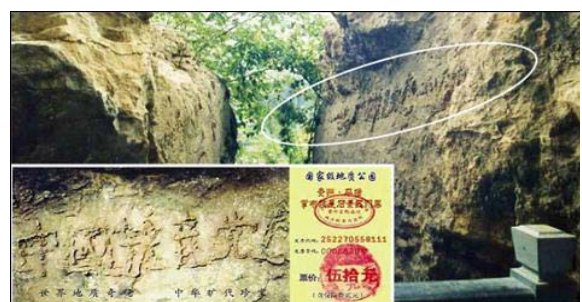
图为『藏字石』照片，小图为风景区门票。

2002年6月，贵州省平塘县掌布风景区发现五百年前崩裂的巨石断面惊现“中国共产党亡”六个大字。经第三批地质专家鉴定“藏字石”为2.7亿年前天然形成，“藏字石”的图片还被印在风景区的门票上。其实这就是上天借着石头告诉中国百姓，天要灭这个贪污腐败、残害人民的中共邪党，所以说“天灭中共”是天意。只有顺应天意，声明“三退”（退出党、团、队组织），才是为自己负责的明智选择。◇