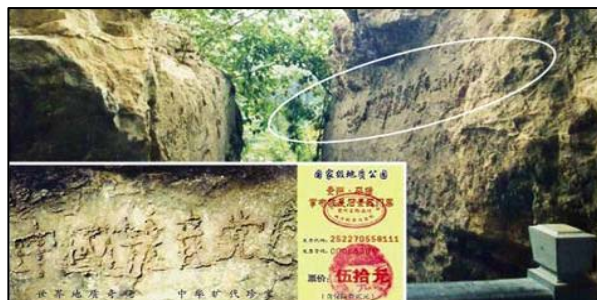
图 为 『 藏 字 石 』 照 片 ， 小 图 为 风 景 区 门 票 。

2002年6月，贵州省平塘县掌布风景区发现五百年前崩裂的巨石断面惊现“中国共产党亡”六个大字。经第三批地质专家鉴定“藏字石”为2.7亿年前天然形成，“藏字石”的图片还被印在风景区的门票上。其实这就是上天借着石头告诉中国百姓，天要灭这个贪污腐败、残害人民的中共邪党，所以说“天灭中共”是天意。只有顺应天意，声明“三退”（退出党、团、队组织），才是为自己负责的明智选择。◇