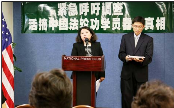
图：华盛顿 DC 法轮大法学会在美国国家记者俱乐部召开新闻发布会，呼吁调查中共活摘法轮功学员器官并贩卖尸体的罪恶

吴女士说：由于北京公安无法将不报住址的法轮功学员遣送回原籍，北京监狱个个爆满，上访学员还在源