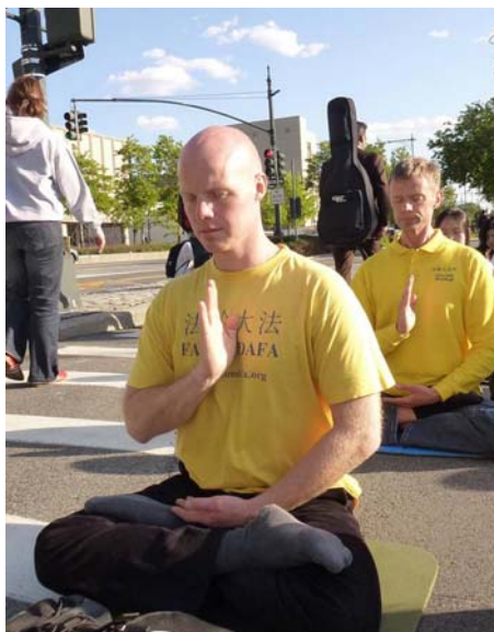
图：2012 年 5 月，马丁斯在纽约。

二零一二年五月十一日，数千名世界各族裔法轮功学员汇聚在纽约，分别在中领馆，联合国大厦前的哈玛绍广场、及炮台公园等地集体炼功和集会，庆祝法轮大法弘传二十周年，