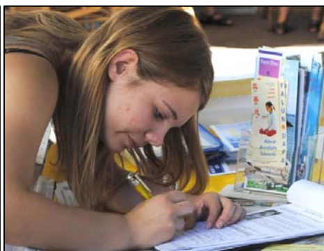
图：德国多个城市熙熙攘攘的人群纷纷签名，支持法轮功学员反迫害