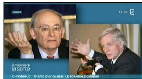
图：二零零九年十二月三日，大卫·麦塔斯（左）和大卫·乔高在法国电视台 TV5 健康栏目中揭露中共活摘器官暴行