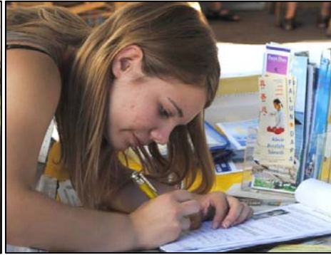
图：德国多个城市熙熙攘攘的人群纷纷签名，支持法轮功学员反迫害