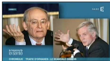
图：二零零九年十二月三日，大卫·麦塔斯（左）和大卫·乔高在法国电视台 TV5 健康栏目中揭露中共活摘器官暴行

【明慧网】美国新闻网络报《赫芬顿邮报》（The Huffington Post）的加拿大版八月三日发表专栏作家彼得·沃辛顿（Peter Worthington）的文章。文章说，加拿大前国会议员乔高（David Kilgour）和加拿大温尼伯的人权律师麦塔斯（David Matas）通过调查获得第一手证据，证实了中国大陆法轮功学员的器官被强行摘取。