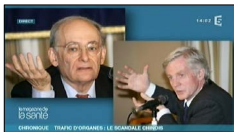
图:二零零九年十二月三日,大卫·麦塔斯(左)和大卫·乔高在法国电视台TV5健康栏目中揭露中共活摘器官暴行

文章说,加拿大政府前内阁(前亚太司司长、前国会议员)乔高和加拿大温尼伯的人权律师麦塔斯调查了在中国是否发生了摘取(法轮功学员)器官的事情,他们的报告作出这样的结论:“在中国发生了,并在今天还在持续发生着从非自愿的法轮功学员身体上大规模地摘取器官行径。”◇