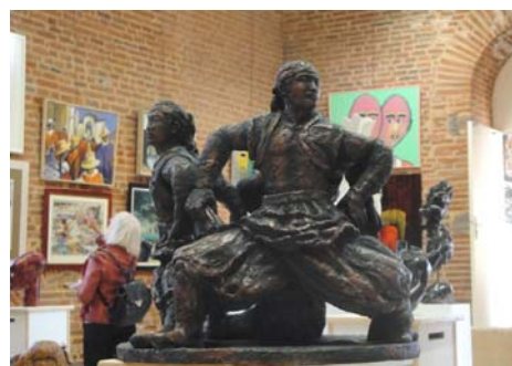
图：本文作者的陶土雕塑《威武矫健的蒙古族小伙子》46x45x36 (cm)

我用陶土雕塑了这个作品，把三个男子塑成一个组雕，他们围成一圈，没有间隔，威武阳刚。这组雕塑作品参加了二零一一年法国南方与塔河省第三十三届艺术沙龙展。◇