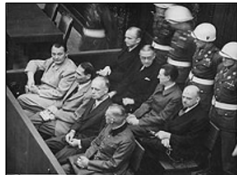
图：纽伦堡审判图片。二战结束后，纽伦堡国际军事法庭否决了迫害帮凶们“奉命行事”的辩解。

德国著名哲学家拉德·布鲁赫说：“法律分法上之法和法下之法，以人类的共同理性，以人的尊严和权利为展示内容的法，是法上之法；以背弃人类理性，漠视人的尊严、践踏人的权利为特征的法，是法下之法。