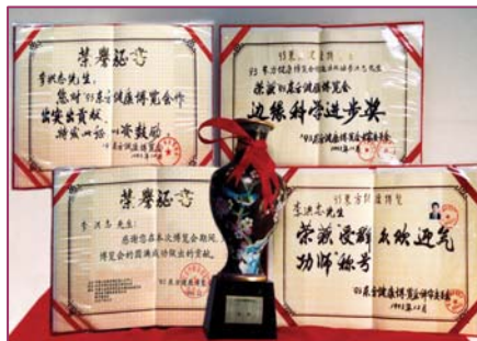
■ 李洪志大师荣获 1993 年健康博览会“边缘科学进步奖”和“受群众欢迎气功师”称号

● 法轮大法弘传世界 法轮功至今已弘传一百多个国家和地区，受到世界人民的爱戴和尊敬。李洪志先生和法轮大法因对人类身心健康做出的杰出贡献，获各国政府褒奖、支持议案和信函 3000 多项。法轮功书籍被译成 30 多种语言，在全球出版发行，并可在网上免费下载。