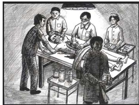
中共活体摘取法轮功学员器官谋取暴利模拟图

2012 年 7 月在加拿大出版的《国有器官》（State Organs: Transplant Abuse in China）一书中，多位世界医学界权威和专家探讨了中共动用国家机器介入器官移植的现象。其中被誉为全球科技界最有影响力的十大人物之一、美国宾夕法尼亚大学生物伦理学中心主任亚瑟·卡普兰在书中提到：中国大陆活摘器官“为需求而杀人”的现象普遍存在。书中收录了多位在国际器官移植领域的著名人士和权威医生的文章。这些文章从