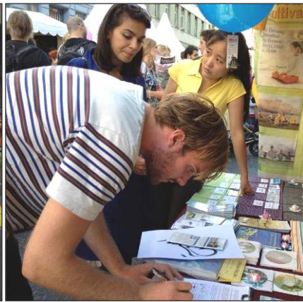
左：丹麦法轮功学员参加游行，微笑着向沿途民众展示“法轮大法好！” 右：许多民众与法轮功学员交谈、了解真相后，纷纷签名支持法轮功。