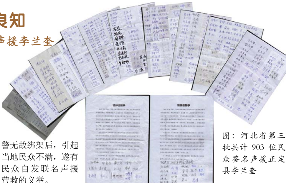
图：河北省第三批共计 903 位民众签名声援正定县李兰奎

河北正定县东安丰村法轮功学员李兰奎在当地小有名气，买卖公道，乐于助人。今年六月遭正定县恶