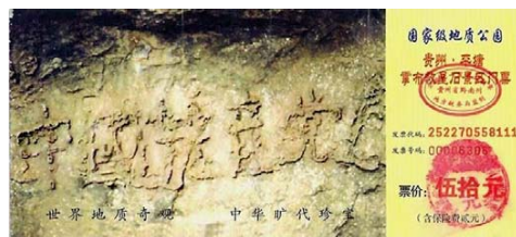
图: 2002 年 6 月, 贵州平塘县掌布乡发现了距今二亿七千万年的“藏字石”, 石头断面上显现“中国共产党亡”六个大字(左图为“藏字石”风景区门票)。

在这场正邪较量的巨变中,每个人都要在善恶间作出选择,对于更多受中共蒙骗的人,了解真相,退出中共,才是明智的自我保全之策! ◇