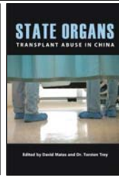
图：《同谋者们》海报 中：著名人权律师大卫·麦塔斯 右：《国有器官》封面