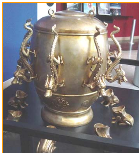
图：中国古代科学异常发达。东汉时期张衡发明了世界上第一台预测地震的候风地动仪，比欧洲早 1700 多年。