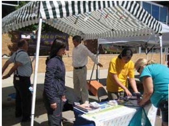
右图：游客南达科他州文化节上学炼法轮功

供在下周六免费教功，有约五十人留下了自己的联系信息，请学员通知他们具体的教功时间、地点。不是本市居民又想学功的人，学员们就建议他们从法轮大法网站上先去了解，如果想学功的话，可