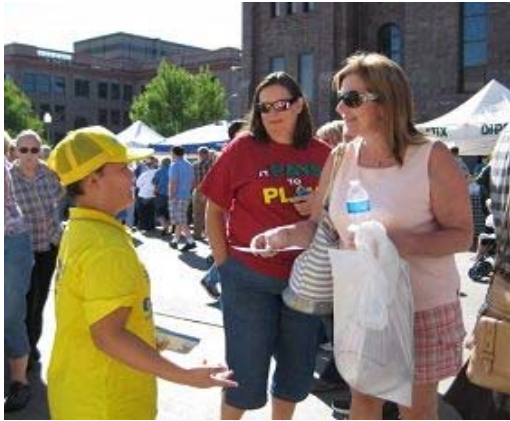
左图：在美国南达科他州文化节上讲真相