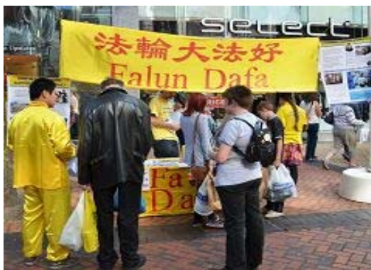
图：英国法轮功学员在伯明翰市中心的步行街举行弘法讲真相活动

学员们在伯明翰市中心热闹的商业步行街上设立了信息台，桌上放有中英文的法轮功真相展板和征签表。学员们拉起“法轮大法好”横幅，挂出真相横幅揭露中共为什么迫害法轮功，以及中共对法轮功进行的系统性、群体灭绝式迫害，甚至活摘人体器官贩卖谋利的暴行。学员们有的向路人分发真相传单，有展示法轮功五套祥和舒缓的功法。签名的民众中，有一位年轻女士是看到横幅就径直走到桌前问：你们的征签表