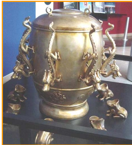
图：中国古代科学异常发达。东汉时期张衡发明了世界上第一台预测地震的候风地动仪，比欧洲早 1700 多年。

如果说宇宙万物是神创造的，那么一个人要探索宇宙的深层奥秘，就要信神敬神，按照神的要求修身养性，淡泊名利，提高自身的道德修为。