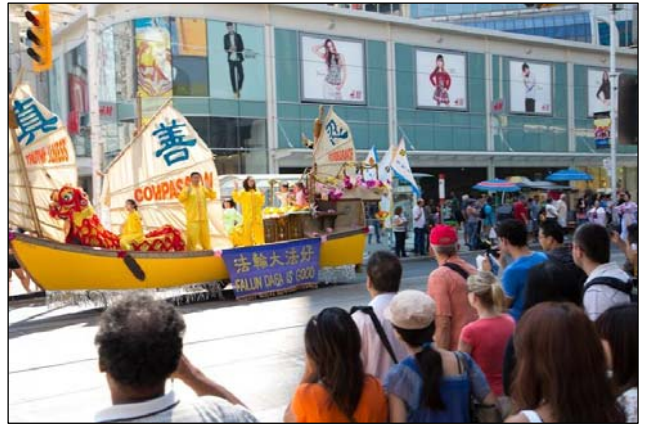
图：法轮功学员和民众在多伦多市中心举行大游行

权——正发生在中国的严重人权践踏。”他说，“随着越多人知道迫害，将会有越来越多的人与你们站在一起抗争，直到我们都有自由。”