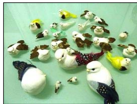
吉林省女子劳教所的奴工产品

量，非常满，完不成就吃不上饭，不能睡觉。实行连坐制牵连到每个人，小组内一人完不成，大家都别睡，所有人身体状态都非常不好。◇