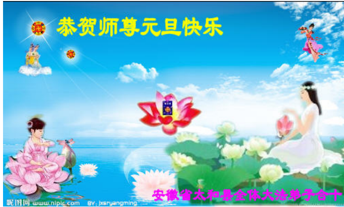
图由安徽太和县大法弟子敬上，恭祝师尊元旦快乐！

明慧网发表来自大陆的元旦贺信始于二零零二年，迄今已逾十年，整理发表这些真挚的贺信也成为明慧网迎接新的一年开端。这些贺信让世人看到，尽管中共江泽民政治流氓集团在过去十三年多的时间里竭力迫害法轮功学员、诋毁法轮功并竭力封堵网络，但是大陆各地法轮功学员仍然坚定信念，向民众传播真相，使得越来越多的人从中共谎言中清醒，以至走入法轮大法的修炼。这些贺信让