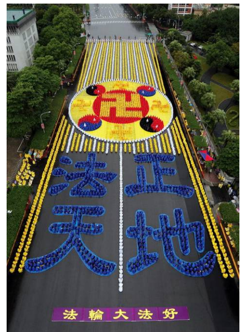
六千多名法轮功学员汇聚台湾总统府前广场，排出“法正天地”及法轮图形

一九九九年七月二十日，中共发动了对法轮功的全面迫害，引发全球法轮功学员反迫害、讲真相活动。这场迫害不仅针对法轮功学员的“真善忍”信仰，也在试图泯灭所有人的道德原则和精神价值。