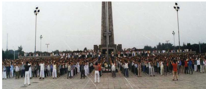
▲一九九九年以前唐山民众在街心广场炼法轮功

当时那个不相信的人也惊呆了。他们都退出了中共的党、团、队组织，都对我告诉他们真相表示很感谢。