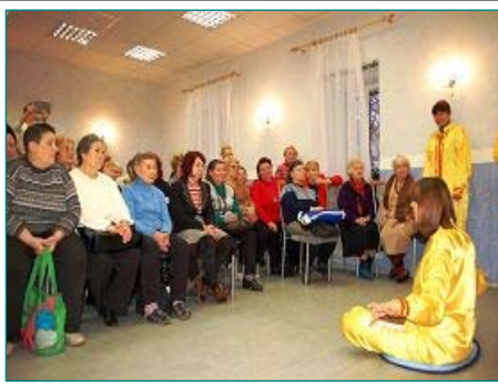
图：在圣彼得堡市某区老年活动中心介绍法轮功