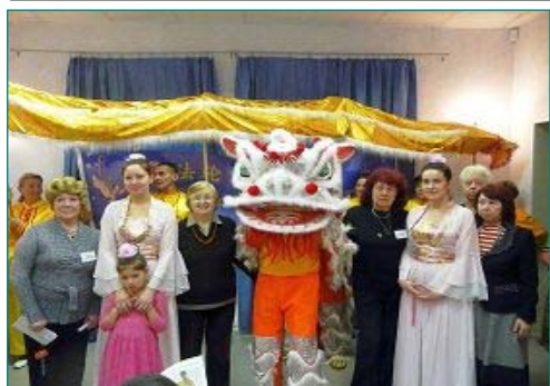
图：在圣彼得堡市某区老年活动中心介绍法轮功