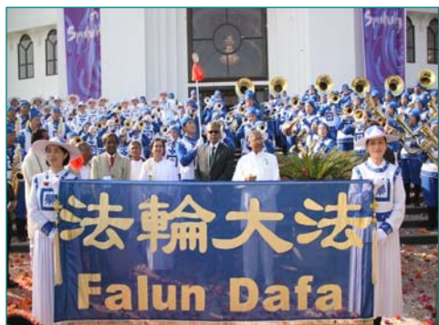
图：天国乐团应邀在印度精神领袖会议演奏

绍法轮大法和当今中国发生的迫害。学员们展示了五套功法、表演了扇子舞、舞龙等。孩子们饶有兴趣地观看，十分高兴地学习五套功法和叠纸莲花。一个十二岁的小男孩还学会用中文说“法轮大法好！”孤儿院的教师们也通过这次活动了解到法轮大法，他们向学员表示衷心的感谢。文章选自《明慧网》有缩减◇（文／俄罗斯法轮功学员）