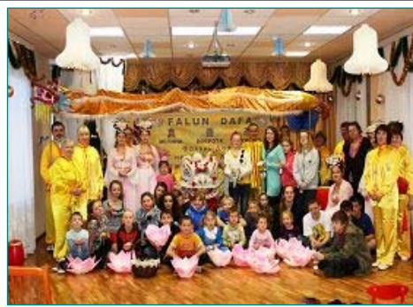
图：在圣彼得堡市某孤儿院介绍法轮功