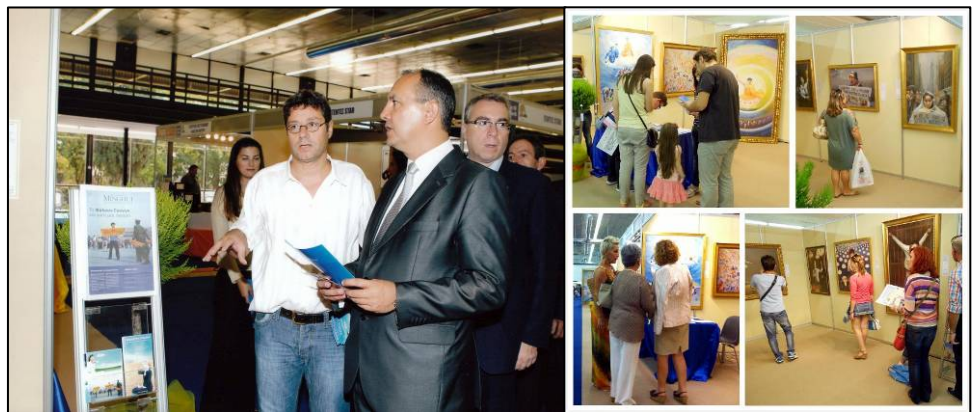
左：希腊北部部长在听法轮功学员讲解；右：观看画展的人们络绎不绝

画展期间，希腊北部部长 Karaoglou Theodoros 先生，议员 Varvitsiotis 先生和议员 Sakorafa 女士，还有欧洲议会议员 Skylakakis 先生等政要都前来参观画展。他们站在“医生活摘法轮功学员器官”那幅油画前，一边凝神看，一遍认真听法轮功学员讲这幅画的背景。当他们听说画面上活摘器官的血腥场面都是根据实际情况画出来的，这样活摘法轮功学员器官的案件在中国大量真实发生过，并且现在还继续发生着时，