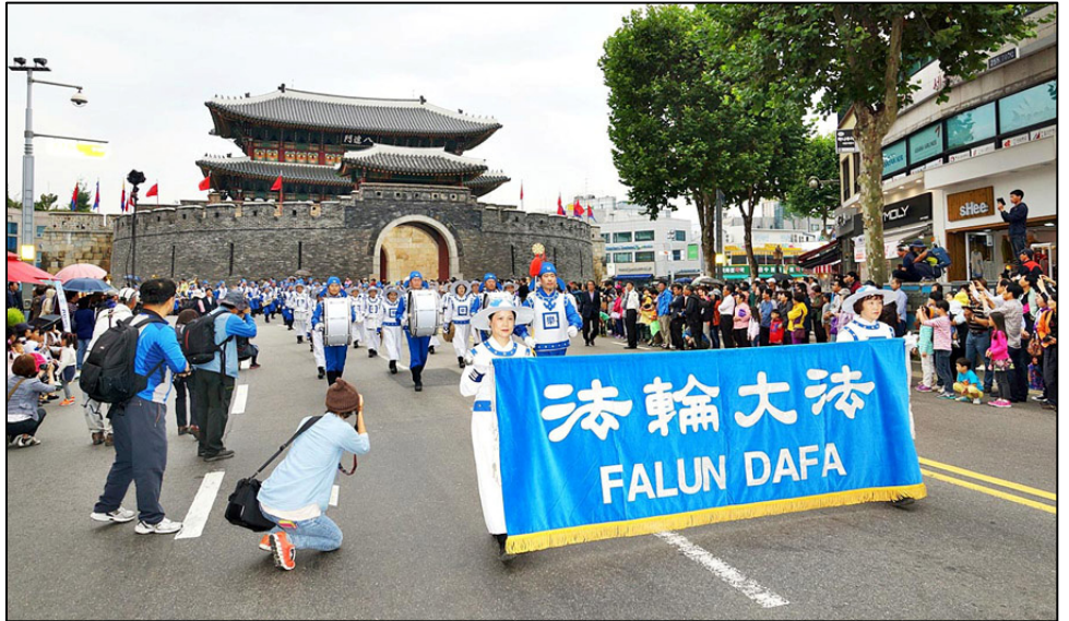
法轮功方阵初登场便受到市民们的热情欢迎