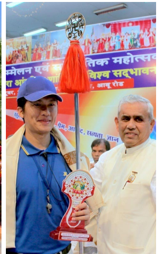
天国乐团在印度阿布山下演奏 右图：主办单位向天国乐团代表颁发奖牌并献上哈达

宾介绍了法轮大法：法轮大法是佛家上乘修炼大法，以宇宙最高特性“真善忍”为根本指导，有五套简单易学的功法。上亿人通过修炼达到了身心健康。他们并讲述了法轮功学员无辜遭受中共迫害甚至被活摘器官的真相。来宾们表示这种践踏人权的事情不可思议，纷纷签名表示反对活摘器官，支持法轮功学员反迫害。