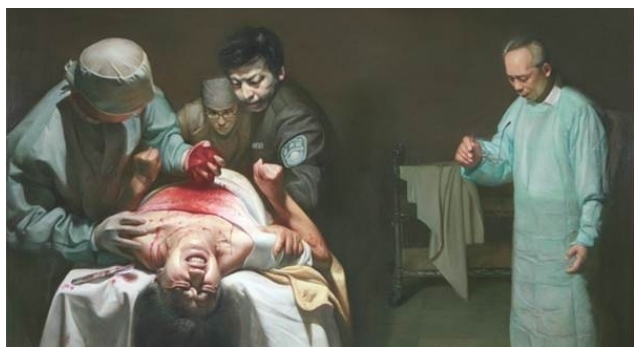
油画《活摘器官的罪恶》

一九八六年的一天，科室领导派我去取一块人体组织，作为实验室切片用。我来到病房大楼一楼的房间，床上躺着一位约二十岁左右的男青年，从裸露的双下肢看，他身体非常健康、结实。我去时，见他的胸腹已被切开，肝、肾等器官已被取走，一位眼科医师正在取他的眼角膜。我向主刀医师要一块食道组织，当医师在他胸部切取时，我突然发现