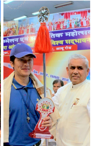
天国乐团在印度阿布山下演奏 右图：主办单位向天国乐团代表颁发奖牌并献上哈达

宾介绍了法轮大法：法轮大法是佛家上乘修炼大法，以宇宙最高特性“真善忍”为根本指导，有五套简单易学的功法。上亿人通过修炼达到了身心健康。他们并讲述了法轮功学员无辜遭受中共迫害甚至被活摘器官的真相。来宾们表示这种践踏人权的事情不可思议，纷纷签名表示反对活摘器官，支持法轮功学员反迫害。