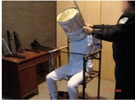
酷刑演示：扣脏水桶，再用木棍敲