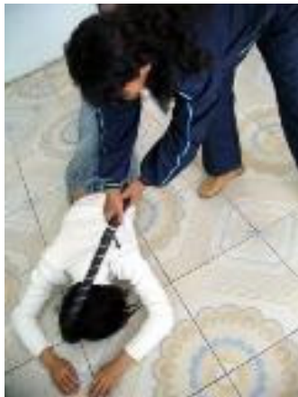
酷刑演示：电棍电击

句东女子劳教所可谓人间地狱，一直紧随邪党江氏集团迫害善良的法轮功学员。对不转化的法轮功学员施以各种迫害：暴力洗脑，24 小时贴身监视、记录一言一行(包括表情和眼神)，长期体罚，站军姿，拖行，多人用力拉扯，电警棍电击，长时间不许睡觉，酷暑站在烈日下曝晒、寒冬站在窗口吹冷风，不许上厕所，指使犯人暴力殴打，绑死人床(手脚分别捆绑在铁床四角)，用脏水桶扣住头再用棍子敲打脏水桶，迫害性灌食，强制灌食不明药物，长期超负荷奴役，甚至剥光衣服性侮辱等等，手段极其卑鄙下流和残忍。