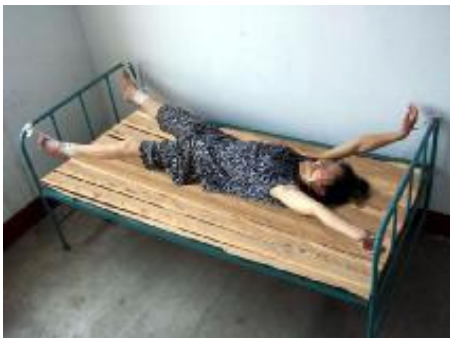
酷刑演示：铐在床上