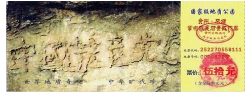
图：贵州“藏字石”风景区门票。

自从马列邪教以中共为表现形式传入中国后，其利用一言堂媒体，向民众灌输谎言，宣扬无神论和斗争