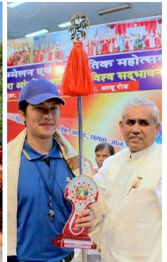
天国乐团在印度阿布山下演奏 右图：主办单位向天国乐团代表颁发奖牌并献上哈达

宾介绍了法轮大法：法轮大法是佛家上乘修炼大法，以宇宙最高特性“真善忍”为根本指导，有五套简单易学的功法。上亿人通过修炼达到了身心健康。他们并讲述了法轮功学员无辜遭受中共迫害甚至被活摘器官的真相。来宾们表示这种践踏人权的事情不可思议，纷纷签名表示反对活摘器官，支持法轮功学员反迫害。