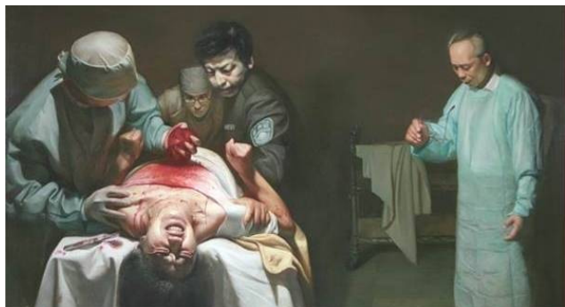
油画《活摘器官的罪恶》

一九八六年的一天，科室领导派我去取一块人体组织，作为实验室切片用。我来到病房大楼一楼的房间，床上躺着一位约二十岁左右的男青年，从裸露的双下肢看，他身体非常健康、结实。我去时，见他的胸腹已被切开，肝、肾等器官已被取走，一位眼科医师正在取他的眼角膜。我向主刀医师要一块食道组织，当医师在他胸部切取时，我突然发现