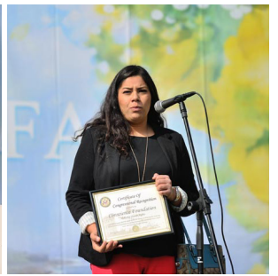
从左至右：集会演讲台；长滩市副市长（左）和市议员（右）；国会众议员罗拉巴克；国会议员桑切斯代表费尔南德斯