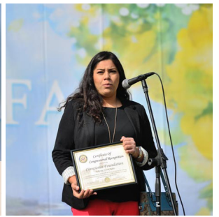
从左至右：集会演讲台；长滩市副市长（左）和市议员（右）；国会众议员罗拉巴克；国会议员桑切斯代表费尔南德斯