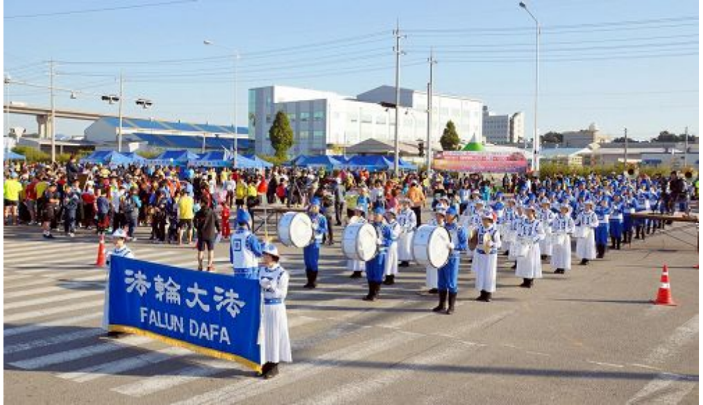
图: 天国乐团参加“二零一三年平泽港马拉松大会”受欢迎。

紧接着马拉松大赛正式开始, 被安排在马拉松起跑线前进行演奏的天国乐团, 每当五千米、一万米赛跑