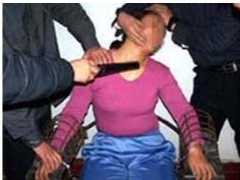
酷刑演示：铐在铁椅子上用电棍电

我在三月二十日下午四点多在沈阳站被一群不明身份的人在没有任何出示任何证件的情况下绑架到一个我根本不知道的地方，有三个男警察把我又绑架到一个没有窗户的屋里，把我扣在一个铁椅上，双手用手铐铐住，双脚也扣住，一点不能动弹，铁椅子冰凉彻骨，然后三个男警察开始打我耳光，打了很多下，因为问我问题我一直不说，他们一直打下去，还使用电棍电击腿部，电击阴部，剧烈疼痛，又开始把我的衣领解开浇冷水，不知浇了多少下，然后用三个纸壳扇风，还拿一个象头盔的东西套住我的头部，用棍子敲，不知敲了多少下，还有一个男警察试图用牙签扎我的手指，打了我多少下我记不清了，浇凉水从头湿到脚，冰凉彻骨，一直