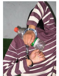
迫害法轮功学员酷刑演示图（从左到右为）：押刑、毒打、吊铐、电击、烟头烫、背剑。