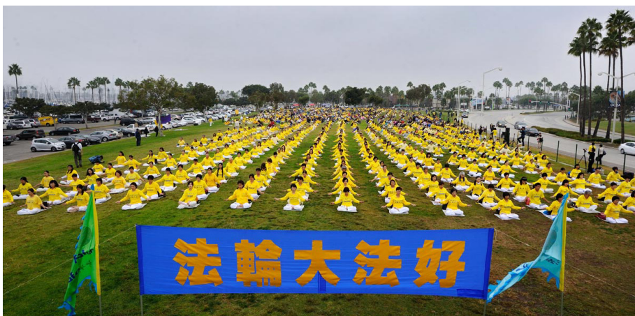
图：二千多法轮功学员在洛杉矶长滩市玛丽娜·格林公园大炼功

参加游行的法轮功学员从世界各地不远千里而来，为的是与人分享法轮大法的美好，制止中共对“真、善、忍”的迫害，还世界以希望。◇