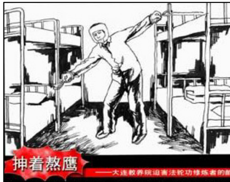
酷刑演示左图：“熬鹰”（长时间站立不让睡觉）；右图：毒打

不知姓名的女孩，有法轮功学员见证了，2002 年她遭受残酷的灌水酷刑迫害：警察找了几个吸毒犯人，把她绑在床上成“大”字状，几个犯人坐在她的肚子、胸、腿、胳膊上，