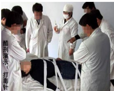
酷刑演示：打毒针（注射不明药物）

2001年元月，她在外地讲真相，被不明真相的世人构陷，遭到非法抓捕，批了二年劳教。安徽女子劳教所的恶警对她强制洗脑，每天很早起，晚上很晚睡觉，十几个小时不停地围攻、洗脑，连吃饭时间也不放过，强逼她放弃信仰，精神