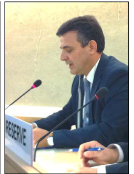
西班牙人权律师 Carlos Iglésias 在联合国人权会议上发言