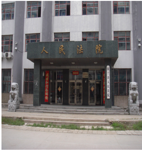
图：诬判法轮功学员的依兰法院

在二零一三年过新年时，黑龙江中共省长王宪魁到各地巡视，在哈同高速公路依兰至宏克力地段，看见跨线桥上悬挂的“法轮大法好”、“法