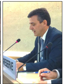
西班牙人权律师 Carlos Iglésias 在联合国人权会议上发言