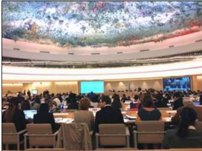
第二十四届联合国人权理事会大会在日内瓦召开