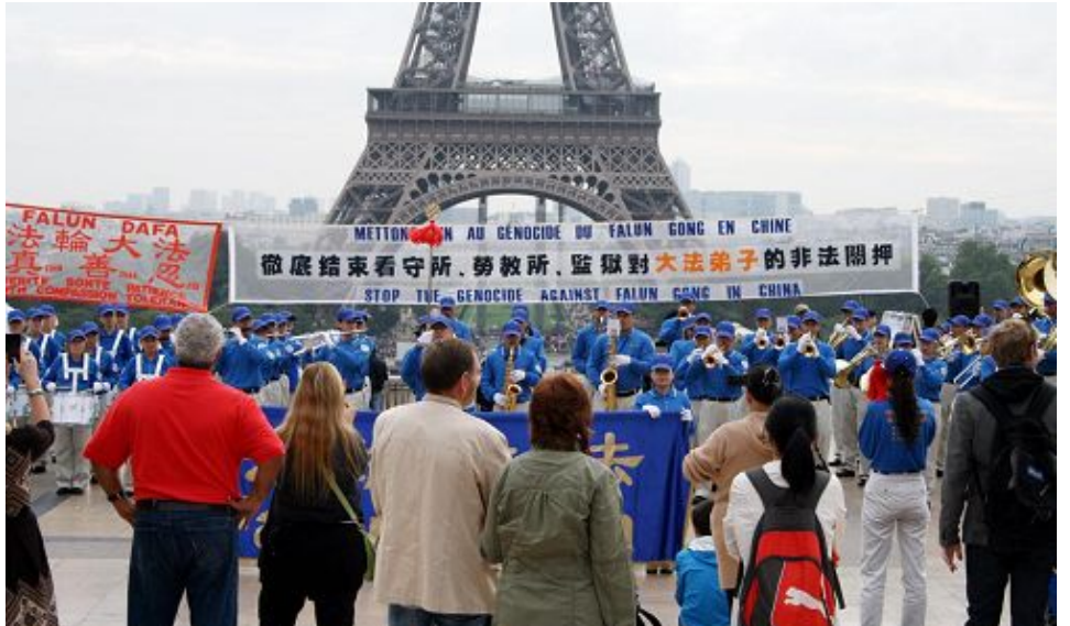
▲ 欧洲部分法轮功在巴黎铁塔前集会, 展现法轮功的美好, 并揭露中共活摘法轮功学员器官等种种罪行。