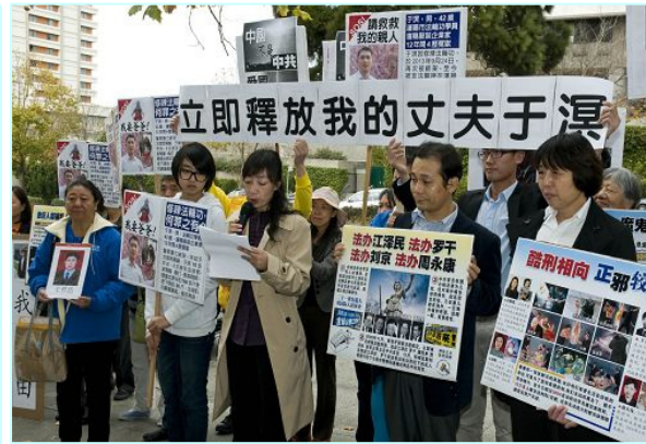
法轮功学员在旧金山中领馆前抗议