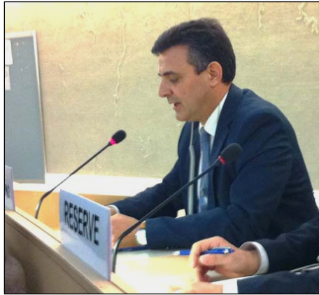
西班牙人权律师卡洛斯·伊克雷西亚斯，2013年在联合国人权会议上发言。

卡洛斯表示，国际社会应效仿西班牙的正义之举。他说：（外国公民）购买的中国器官大多都是非法获得。除了被处决的犯人，还有法轮功学员，成千上万的人被当作活体器官库，这