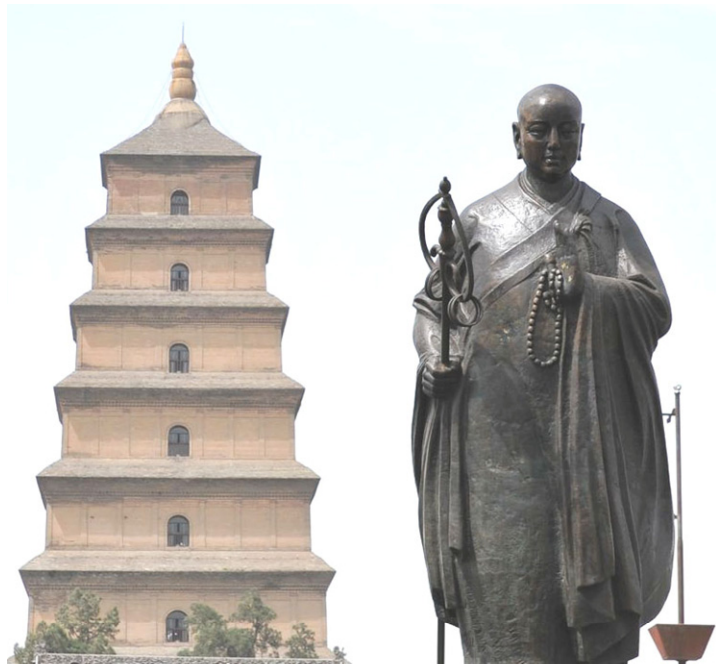
西安大雁塔前的玄奘塑像