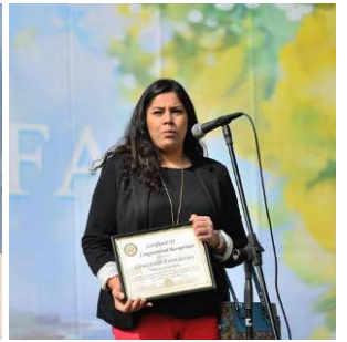
从左至右：集会演讲台；长滩市副市长（左）和市议员（右）；国会众议员罗拉巴克；国会议员桑切斯代表费尔南德斯